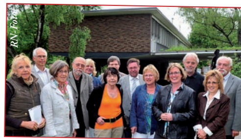
Die Gründungsmitglieder des Vereins am 1. Juni 2010 vor der alten Bücherei.

Diesem Ziel fühlt sich der Förderverein Cornelia Funke Baumhaus verpflichtet. In Kooperation mit der Dorstener Stadtbibliothek knüpfen Kinder und Eltern, Schüler und Lehrer, Vorlesepaten, Verlage und andere engagierte Leseförderer gemeinsam an einem starken Netzwerk zur Förderung der Lesekultur. Jeder ist herzlich willkommen, als Multiplikator mitzuwirken, auf dass sich bei den Menschen tausend Türen im Kopf und im Herzen öffnen mögen.